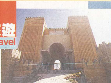
▲亞述王國第二個首都——尼姆魯德古城。