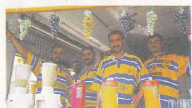
▲伊拉克的果汁小店。

尼米微古城 (Nineveh) 位於底格里斯河東岸，摩蘇爾城郊。亞述國王西拿基立 (Sennacherib) 於公元前 704 年定為第三個首都。這個古城城牆原長 12 公里並有 15 個城門，每一個城門按不同的亞述神祇命名。現於遺址只能見到部分的城牆及城門，而城牆外的浮雕石則被移往英國的博物館。