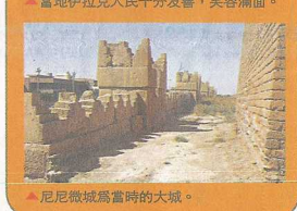
▲尼米微城為當時的大城。

熟悉約聖經的朋友，相信對這個尼米微古城不會陌生。曾經有一日，神吩咐先知約拿前往尼米微城傳福音，約拿起初拒絕，一走了之逃避神，誰知航行中起大浪，且不幸被大魚吞入肚裏去。3 日 3 夜，終於憑告得以免脫，並奉差遣前往尼米微城去。約拿警告尼米微人，40 日內不悔改的話，這城必定傾覆。奉尼米微人下至平民，上至國王，都信而悔改，神遵守諾言不降其災。惟約拿不甘心自己敵對的民族悔改得救，神再次以一棵樹改變約拿。「這蓖麻不是你栽種的，也不是你培養的，一夜發生，一夜乾死，你尚且愛惜，何況這尼米微大城，其中不能分辨左右的有 12 萬多人，並有許多牲畜，我豈能不愛惜呢？」