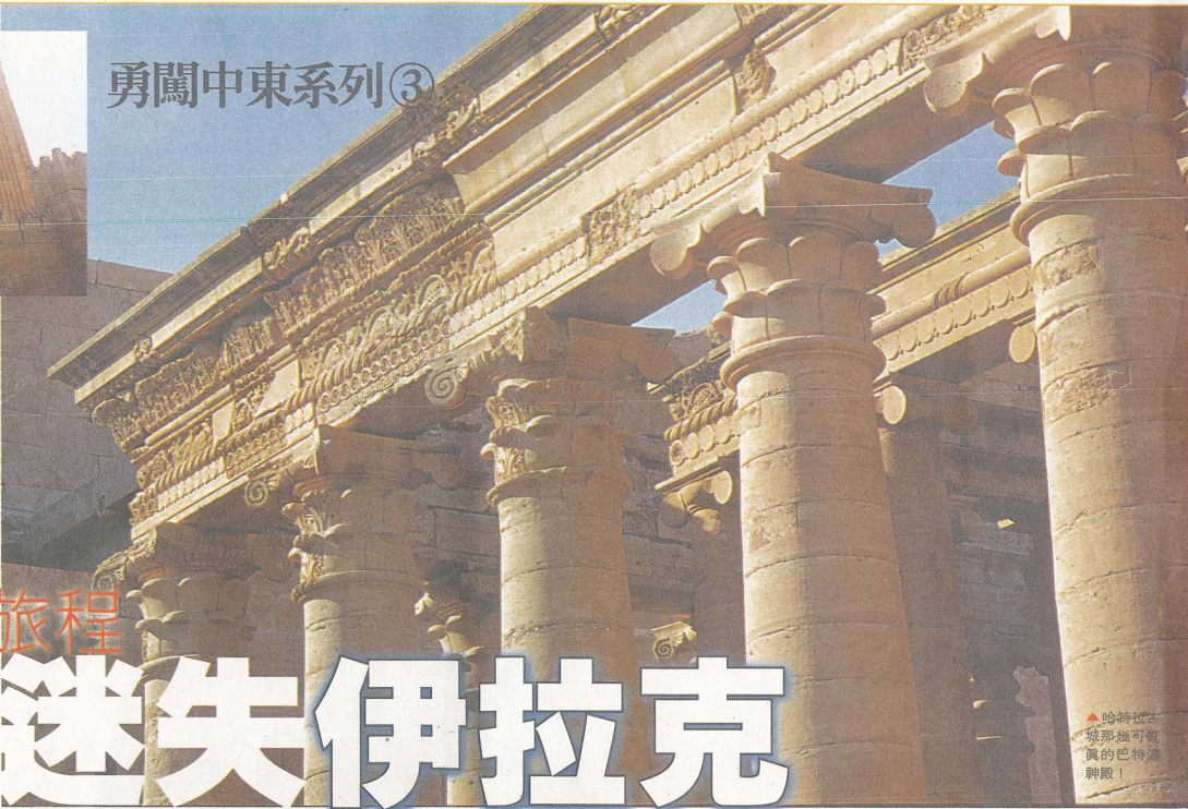
▲哈特拉古城，這座由新巴比倫人建造的巴比倫神廟！

伊拉克共有兩個遺址被列入聯合國遺產，哈特拉古城 (Hatra) 為其中之一。哈特拉位於摩蘇爾西南面 80 公里，其歷史可追溯到公元前 300 年，到公元前 200 年為絲路上重要的貿易